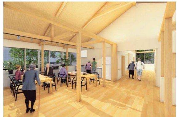
②シェルター案 内観イメージ