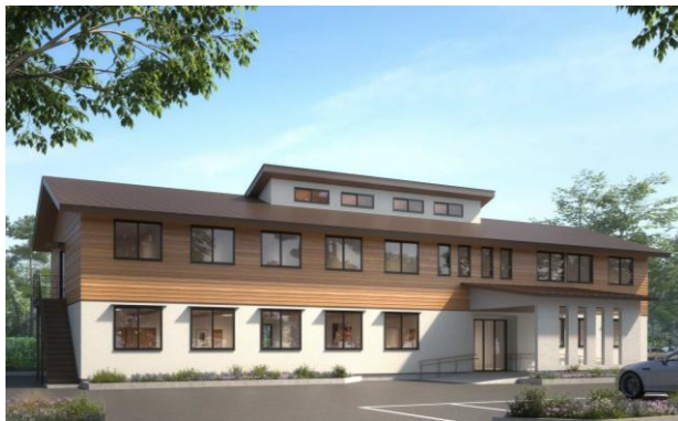
①JBN・中大规模木造プレカット技術協会案 外観イメージ