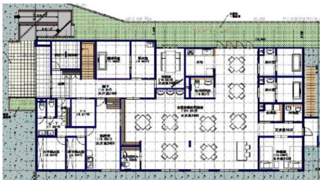
③住友林業案 1階平面図