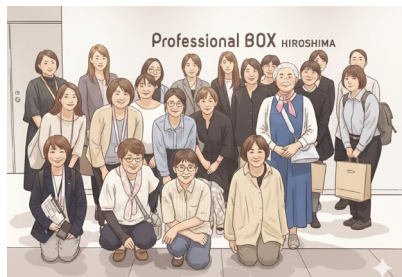
■研修会 照明の勉強でPanasonic広島さんへ訪問 山口大学工学部の学生さんと一緒に参加しました。

女性部は、女性建築士同士の交流の場です。活動は「みんなで楽しく♪」をモットーに、実務に役立つ研修会の開催、建物の見学会や街歩きなど、いろいろなイベントを企画・運営しています。もちろん青年部と一緒に活動する事もありますよ！ぜひ一度、気になるイベントに参加してみてください、部員一同お待ちしております！