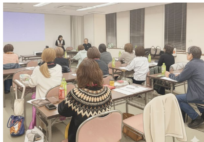
■庭づくり勉強会 暮らしを豊かにする外構計画を学ぶ 実践的セミナーを開催しました。 講師は造園会社の社長さんです。