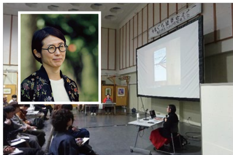
■やまぐち建築セミナー 著名な建築家の講師を招いて、ご講演を頂くイベントを毎年行っています。

青年部は、建築士会に入会した 45歳以下 の方がメインとなって、いろいろな活動やイベントの企画・運営を行う集まりです。青年部で活動している内容やイベントについて簡単に紹介をさせていただきますので、興味のある方は是非とも、ご参加ください！