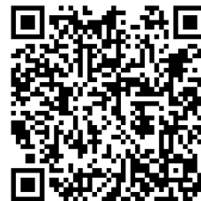
■その他イベントなど フェイスブックで活動の内容や報告について随時更新しています。