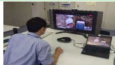
技術者が、カメラ映像を確認し、現場へ指示