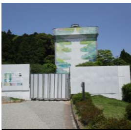
【受付場所】 パネルゲート前