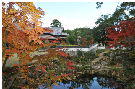
第14回景観賞作品 「長府毛利邸」