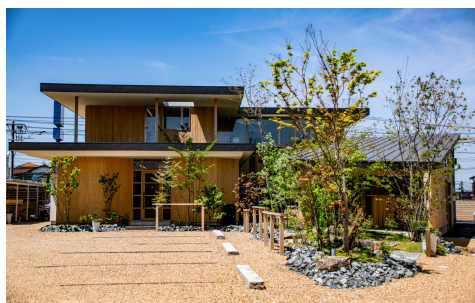
第14回景観賞作品 「T-style の社」