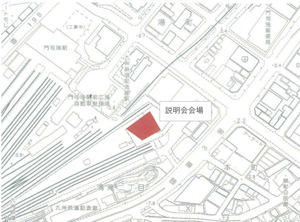
第2図 説明会会場詳細図