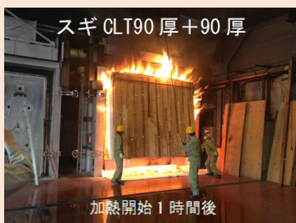
CLT 加熱実験の様子 (高知県)

【受賞歴】 「奈良の木」デザインコンペ2013優秀賞 谷中の町家～吉野杉による木造準耐火建築物 ウッドデザイン賞2016林野庁長官賞 堀切の家