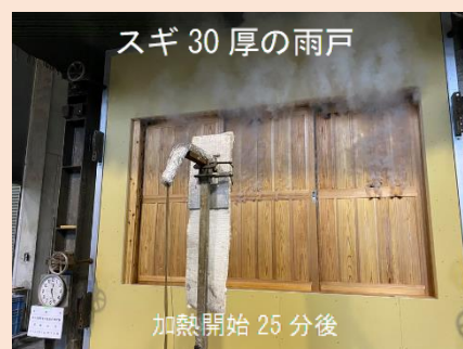
木製防火雨戸の加熱実験の様子 (京都市・京都府建築工業協同組合)