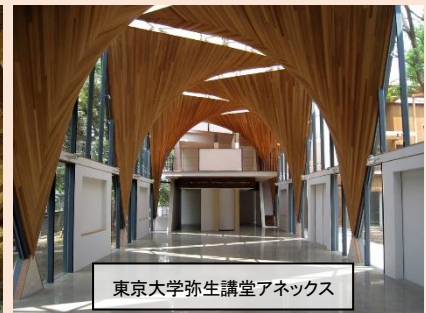
東京大学弥生講堂アネックス