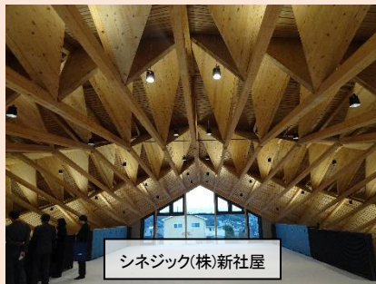
シネジック(株)新社屋