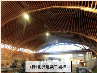
(株)北沢建築工場棟

2002 日本建築学会賞(技術)、松井源吾賞、2006 杉山英男賞、2009 JSCA 賞、2013 日本建築士連合会優秀賞、2014 日本建築仕上学会賞(作品賞・建築部門)、2016 BCS 賞、2019 日本建築学会教育賞(教育貢献)