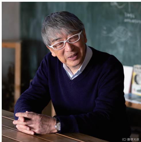
伊東 豊雄 伊東豊雄建築設計事務所 (百島支所・向東認定こども園)