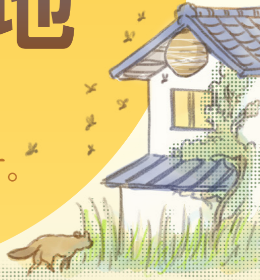
雑草や害虫の発生