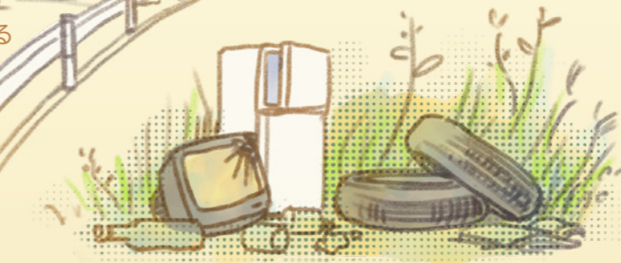
所有地へのゴミ投棄