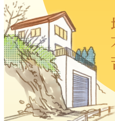
がけ崩れによる 道路の封鎖