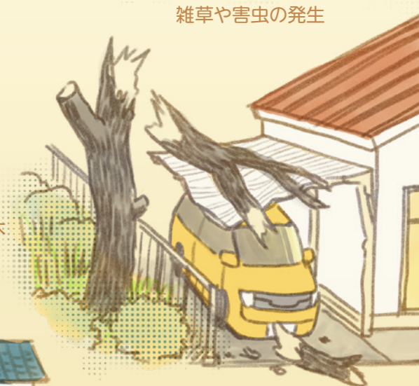
台風や積雪による倒木