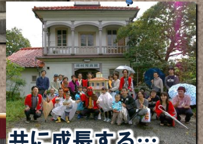
仲間と、共に成長する...